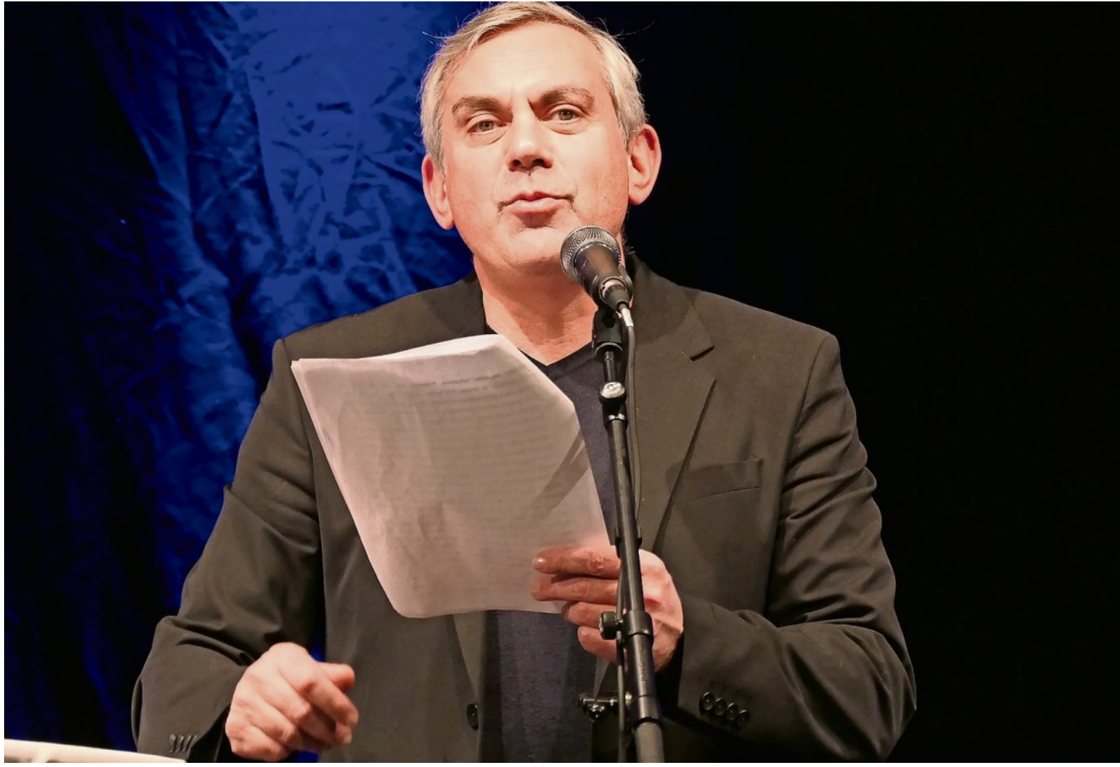
Der Schriftsteller und Kolumnist Wladimir Kaminer bei seiner Lesung im Rahmen des Horizonte-Festivals im Ratssaal.

Angestrebt wird von den Initiatoren eine enge Koope- ration mit dem Kreiskranken- haus. Dort allerdings wird sel- ber daran gearbeitet, in ei- nem Anbau Platz für weitere Fachpraxen - als Alternative zum Ärztehaus - zu schaffen.