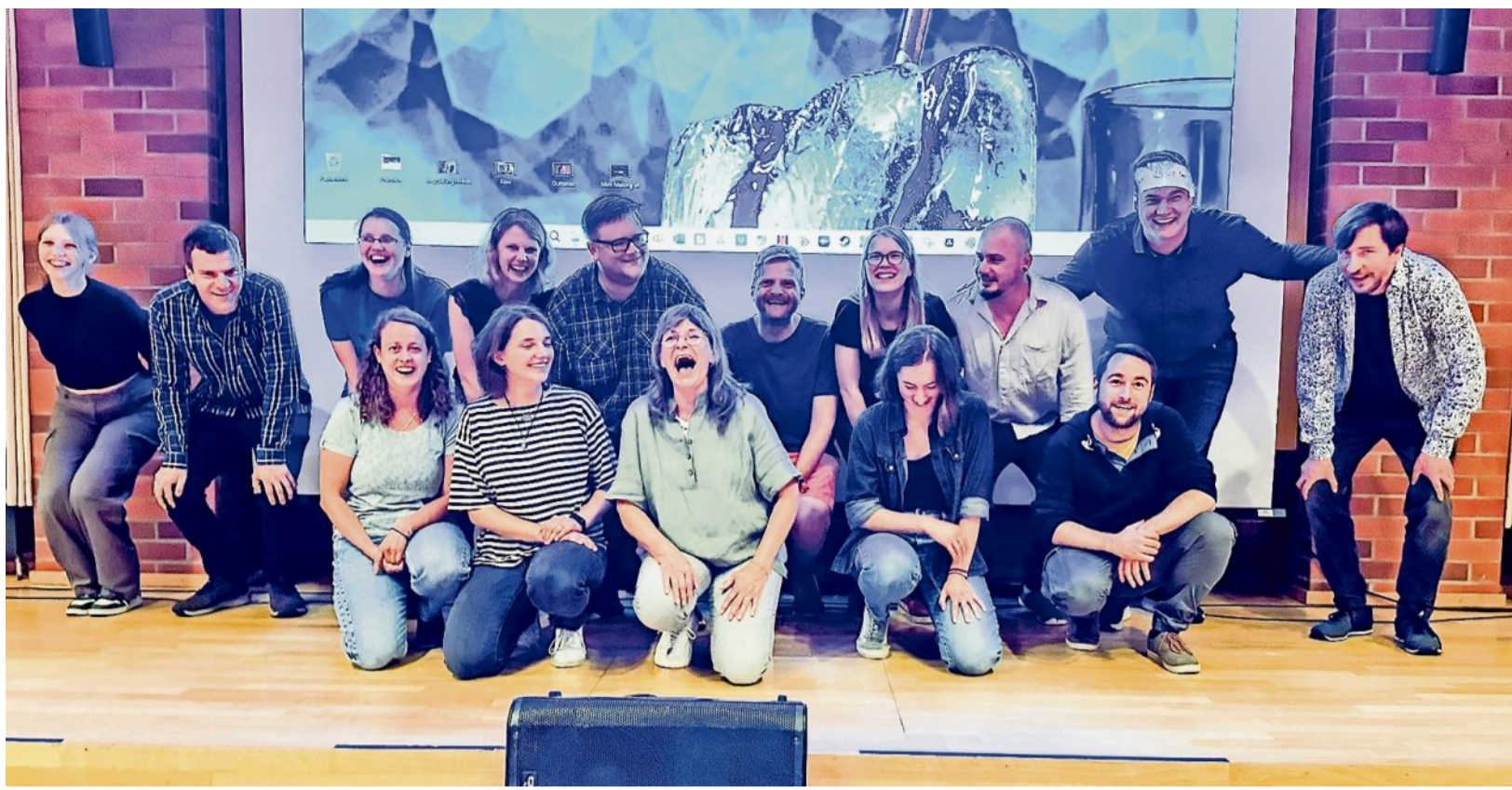
Die Filmcrew von „Crushed Ice“ freut sich über die gute Resonanz für die Doppelpremiere im Rathaus Bremervörde.