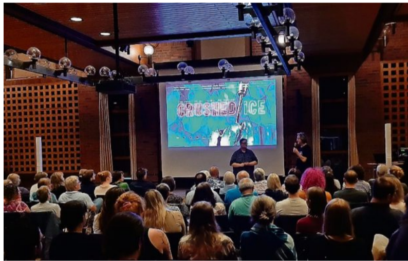
Am Samstagabend war der Bremervörder Ratssaal um 18.30 Uhr und dann um 21 Uhr zweimal gut gefüllt.