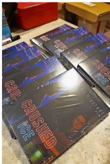
Am Ausgang konnten DVDs und Poster erworben werden.

anstellung zusammen mit der Theater AG organisiert hat, konnte der Filmabend begin-