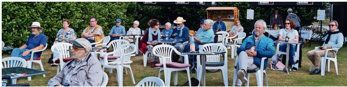
Viva Valente! Einige Bremervörderinnen und Bremervörder freuten sich über die Neuinterpretation alter Schlager.